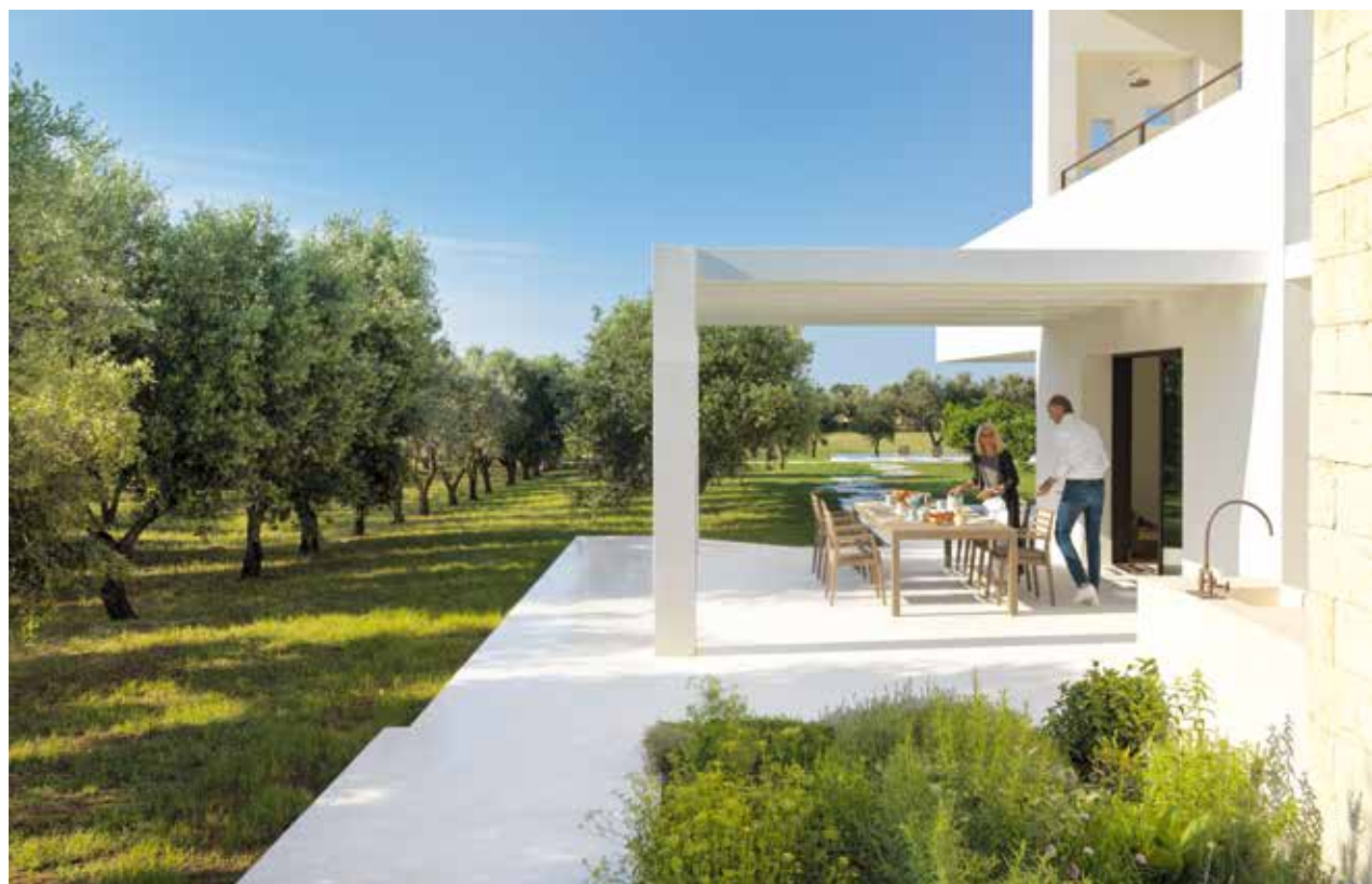
All'ombra della pergola Elke e Hanspeter apparecchiano la tavola, a due passi da un uliveto di 7 ettari. Arredi di Ethimo. In basso, la camera padronale con letto su progetto e poltrona di Pastoe. Pagina a fianco, la facciata nord dell'edificio, un incastro di volumi semplici in tufo e intonaco a calce, materiali della tradizione locale.